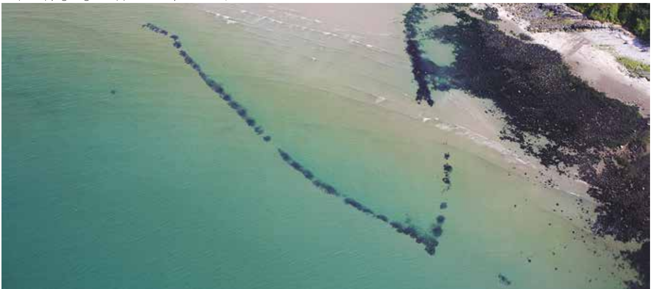
Trapiau pysgod ger Poppit Sands yn Sir Benfro.

Yn benodol, dylai awdurdodau cynllunio lleol sicrhau y caiff gwybodaeth am asedau treftadaeth a'r amgylchedd hanesyddol ehangach a gynhyrchir fel rhan o'r broses gynllunio ei hadneuo yn eu CAHau.